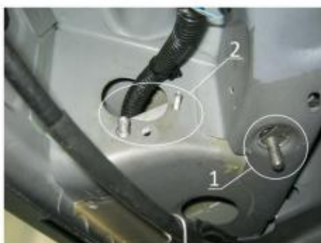
Рис.4 Место крепления заднего кронштейна.