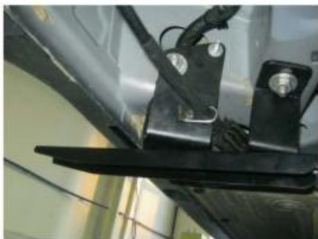
Рис.6 Установка заднего кронштейна.