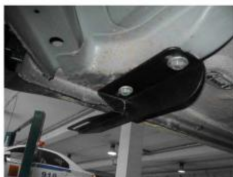
Рис.3 Установка переднего кронштейна