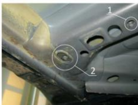
Рис.2 Место крепления переднего кронштейна.