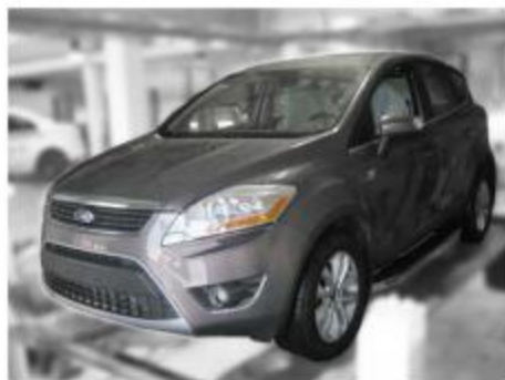
Рис.5 Вид автомобиля с порогом