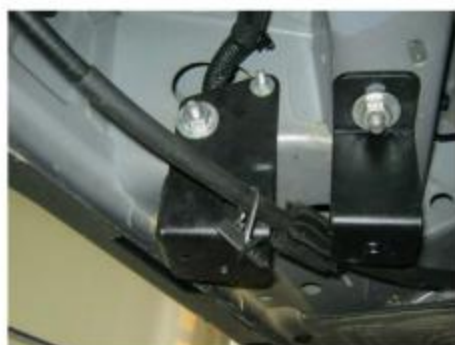
Рис.5 Установка креплений для заднего кронштейна.