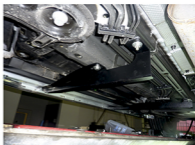
Рис. 2 - Установка переднего кронштейна