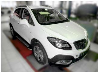
Рис. 7 - Общий вид автомобиля с порогом