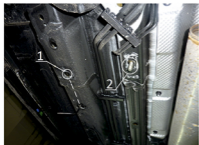
Рис. 1 - Место установки переднего кронштейна