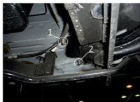
Рис. 5 - Место установки заднего кронштейна