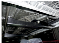
Рис. 4 - Установка среднего кронштейна