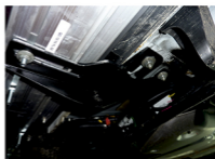
Рис. 6 - Установка заднего кронштейна