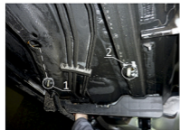
Рис. 3 - Место установки среднего кронштейна