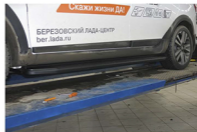
Общий вид автомобиля с порогом